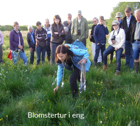
Blomstertur i eng

Affaldsindsamlingen: Er en fast begivenhed i april. Det er et samarbejde mellem DN Mariagerfjord, grønt råd, kommunen, skoler, børnehaver, dagplejere, borgerforeninger, spejdere og andre foreninger.