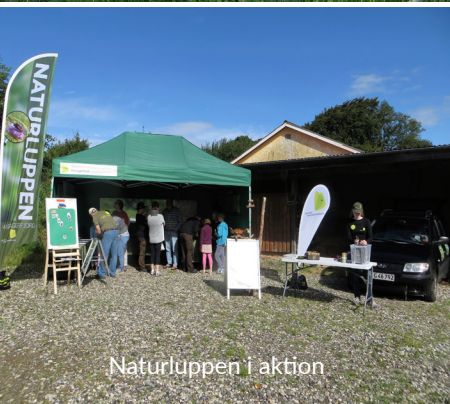
Naturluppen i aktion