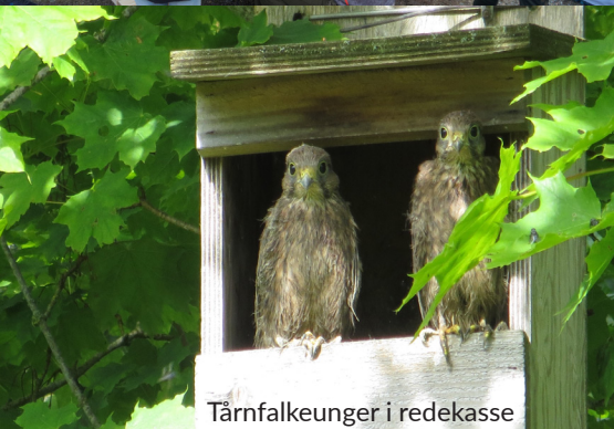
Tårnfalkeunger i redekasse