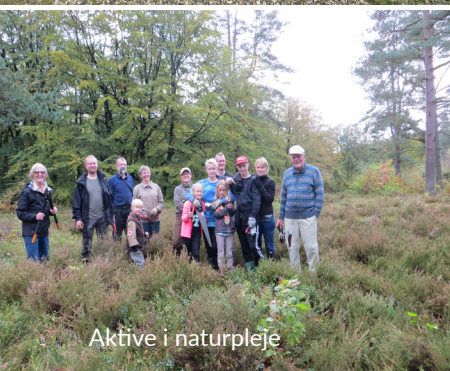
Aktive i naturpleje