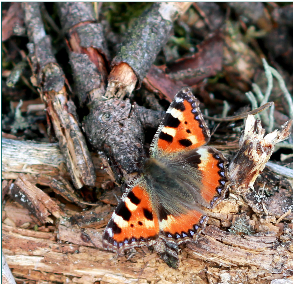
Nældens takvinge soler sig på en lun kvasbunke.