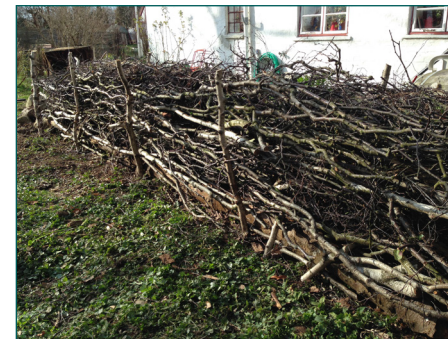
Man kan nemt lave kvasbunken til et grenhegn i haven, og bruge det til at lave rum eller afgrænsninger.

Dyrene er dog ligeglade med, om kvaset er lagt i sirlige bunker. Alt det træ og kvas, man beholder i haven binder CO 2 , så kvasbunker hjælper også en lille smule i klimaregnskabet.