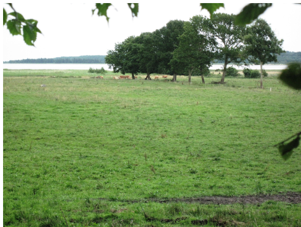
Udsigt ud over Ajstrup Bugt

Prøv en tur på små grusveje, skovveje og stier, samt lidt på asfalteret vej.