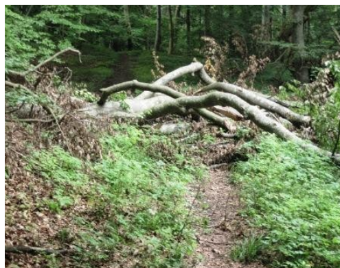
En forhindring man evt. kan møde