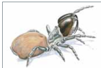
Nordlige fugleedderkop - Atypus affinis

En specialitet for området er den sjældne fugleedderkop, der i Linddalene har en af sine nordligste forekomster i Europa! Du kan lede efter arten på de tørre og solbeskinnede skråninger.