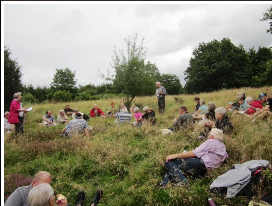
Hviletid under vandretur.