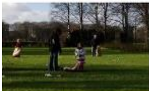
Danmarks Naturfredningsforening Mariagerfjord